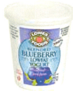
Marca del supermercado: $0.55/envase